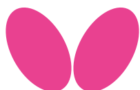
TABLE TENNIS FOR YOU 卓球をあなたへ